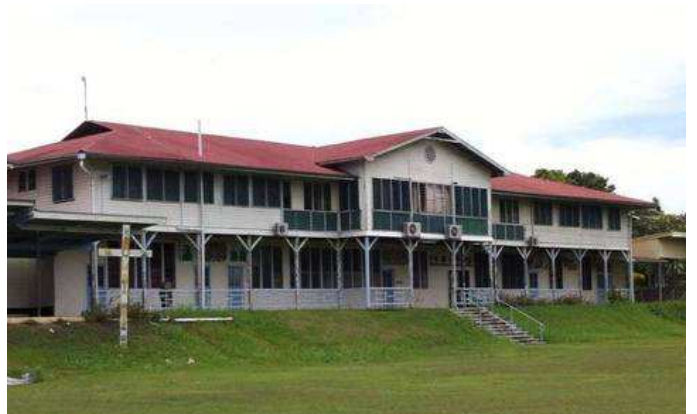
Das Hauptgebäude der Missionsstation Vunapope heute.

Unserdeutsch diente dabei offenbar stark identitätsstiftend und dem Ausdruck der Solidarität untereinander, teilten die Waisenkinder doch ein schweres gemeinsames Schicksal. Schon aufgrund ihrer Hautfarbe saß die Gruppe zwischen den Fronten deutscher Missionare und der indigenen Bevölkerung, von beiden Seiten als nicht dazugehörig, ja minderwertig betrachtet. So diente Unserdeutsch frühzeitig in erster Linie als Ingroup-Sprache, konnte sich damit einhergehend rasch stabilisieren und erfüllte dabei auch komplexere Funktionen. Eine seltene Besonderheit, denn die meisten Kreolsprachen dienen in ihrer Entstehungsphase – dem Pidgin-Stadium, in dem die Sprache noch nicht die Erstsprache einer Sprechergemeinschaft ist – als Verkehrssprache nur der rudimentären Kommunikation zwischen ethnisch verschiedenen Gruppen. In ko-