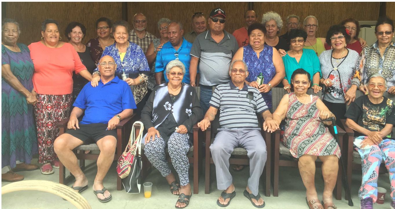
Einige der letzten Unserdeutsch-Sprecher in Brisbane, Queensland.